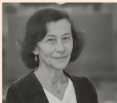
La presidenta del Banco Central, Rosanna Costa.

En su última reunión, el Banco Central de Chile volvió a reducir la tasa de interés en 25 puntos base, dejándola en 4,5%, su nivel más bajo desde diciembre de 2021, cuando se encontraba en 4%. Además, en su Informe de Política Monetaria (IPoM) de diciembre revisó al alza las expectativas de crecimiento para 2026, previendo una expansión del Producto Interno Bruto entre 2% y 3%, más alto que el de 1,75%-2,75% proyectado en septiembre. Para los precios también se mejoró la perspectiva: la inflación llegaría al objetivo de 3% en el primer trimestre de 2026, mientras que hace tres meses se pensaba en el tercero. Para el indicador sin volátiles, el retorno al 3% la autoridad lo ve hacia mediados del próximo año. No obstante, en el IPoM advirtieron que los riesgos del panorama internacional continúan siendo elevados, ya que persisten las tensiones geopolíticas, más allá de que algunas se han atenuado. Dado este cuadro, en el mercado los cálculos consideran que el ente emisor ya estaría cerca del término del ciclo de bajas de tasas y, en el mejor de los casos, quizás solo quede una el próximo año.