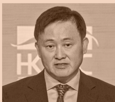
El gobernador del Banco Popular de China, Pan Gongsheng.

El pasado lunes, el Banco Popular de China dejó sin cambios las tasas de interés preferenciales de préstamos de referencia por séptimo mes consecutivo en diciembre. En virtud de esta decisión, se mantuvo en 3% y el interés a cinco años en 3,5%. En su informe de política monetaria del tercer trimestre, publicado durante noviembre, el banco central del gigante asiático indicó que “los principales indicadores económicos se mantuvieron en general estables, demostrando una sólida resiliencia y vitalidad” y que el PIB se expandió a un ritmo anual de 5,2 % anual en los tres primeros trimestres de 2025. Mientras tanto, la inflación llegó a 0,7% anual durante noviembre. No obstante, en la Conferencia Central de Trabajo Económico celebrada en Beijing este mes, las autoridades chinas se comprometieron a mantener una política fiscal “proactiva” en 2026, para estimar el consumo y la inversión para un “alto” crecimiento económico. Con todo, se espera que la economía crezca 5%.